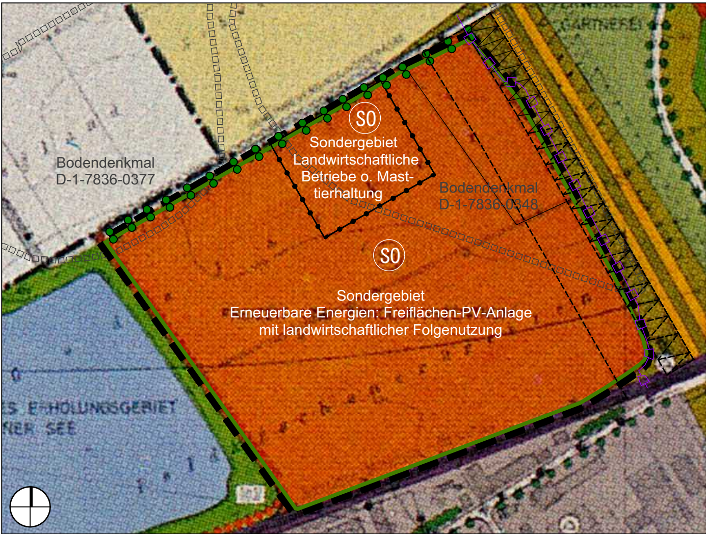
Planung, M 1:5.000