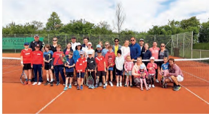
Bilduntertitel: Saisoneröffnung 2024 beim SVH für Groß und Klein.

Bei bestem Tennismetter trafen sich am Sonntag, 28.04. zahlreiche Mitglieder auf der Tennisanlage des SV Heimstetten zum Saisonauftakt. Am Vormittag zeigte der Tennis-Nachwuchs sein Können: ca. 20 Kinder übten mit der gelben Filzkugel, spielten Rundlauf und andere lustige Tennisspielchen. Anschließend ging es dann zum gemeinsamen Mittagessen in die Sportgaststätte „Zum Kelten“. Am Nachmittag trainierten schließlich die Erwachsenen aus dem Freizeit- & Mannschaftsbereich zusammen, bevor dann am Abend der Grill angeschmissen wurde und sich alle an einem reichhaltigen Grillbuffet erfreuen konnten. Wir freuen uns auf die bevorstehende Saison mit tollen Spielen in den verschiedenen Altersklassen und wünschen allen Mannschaften viel Erfolg.