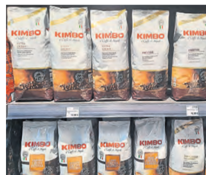
Das neue EspressoKult in der Räterstr. 20 bietet nicht nur Kaffee in allen möglichen Varianten, sondern auch Feinkost, Teesorten, Zubehör, u.v.m. an.