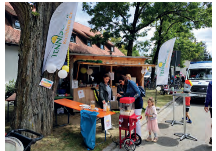
Unser Stand 2022 beim Aufbau

Und es warten noch andere Preise bei der Verlosung auf Euch.