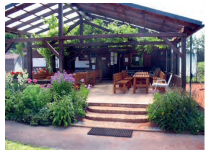
Vereinsheim des TC83

Am Sonntag ab 10 Uhr lassen wir die Feierlichkeiten bei einem Weißwurstfrühstück ausklingen. Wir freuen uns auf Euren Besuch.