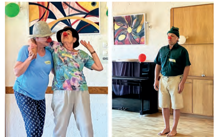
Dafür schlägt mein Herz