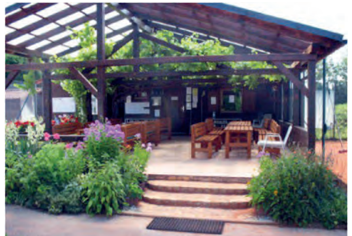
Vereinsheim des TC83

Am Sonntag ab 10 Uhr lassen wir die Feierlichkeiten bei einem Weißwurstfrühstück ausklingen. Wir freuen uns auf Euren Besuch.