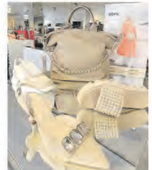
In Szene gesetzt – Schuh Sirch präsentiert aktuelle Schuhmode und Sommertrends 2023.

Fotos und Text: Gabriele Uelses HALLO-Verlag