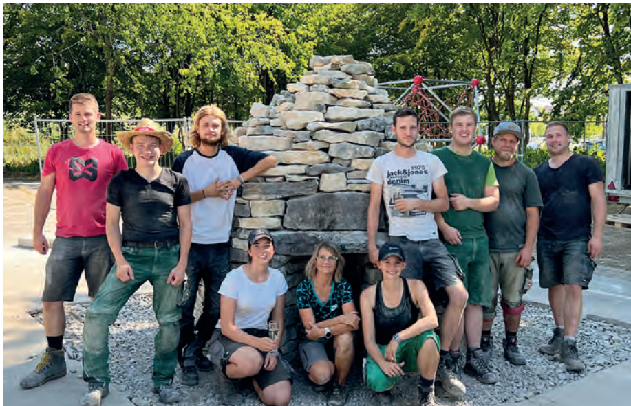
Wer oder was ist ein Tholos? Die Studierenden der Hochschule Weihenstephan-Triesdorf wissen das nun ganz genau. Im Rahmen eines Studienprojekts haben sie den traditionellen Rundbau aus Steinen Stück für Stück an seinen neuen Standort östlich der Grund- und Mittelschule versetzt.

Der Kirchheimer Tholos ist ein Geschenk der italienischen Partnergemeinde Caramanico und steht seit 2012 in der Gemeinde. In den Abruzzen diente ein Tholos einst als Zuflucht vor Wind und Wetter. In Kirchheim steht der Rundbau aus acht Tonnen Stein sinnbildlich für die Freundschaft mit Caramanico: Sie ruht auf einem festen Fundament und hat auch in schwierigen Zeiten Bestand.