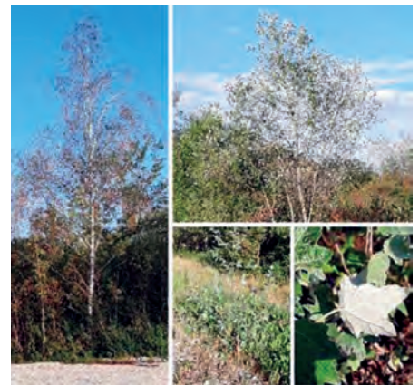
links Birke, rechts Silberpappeln

Liebe Mitglieder, unser Frühstücksstammtisch wurde auf vielfachen Wunsch zum Mittagstammtisch geändert. Wir treffen uns wie bisher immer am letzten Montag des Monats, jetzt aber um 12 Uhr zum Mittagessen in der Sportgaststätte Tassilo in Aschheim.