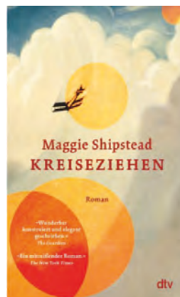
Maggie Shipstead: Kreiseziehen / dtv Verlag

Das einfühlsame Porträt eines Dorfes, ein Buch über Abschiede und die Liebe unter schwierigen Vorzeichen, über den Krieg und die unstillbare Sehnsucht nach vergangenem Glück.