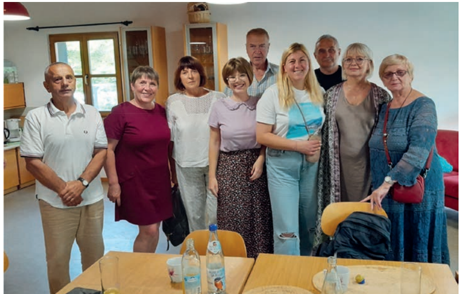
Der Anfang ist gemacht. Auf dem Bild sieht man einen Teil der Teilnehmerinnen und Teilnehmer und die Dolmetscherinnen.

Am 25.08.22 fand im Haus der Begegnung das erste Ü60er-Treffen der geflüchteten Menschen aus der Ukraine statt. Bei Kaffee und Keksen konnten sich alle kennenlernen und über ihr Leben in der Ukraine berichten.