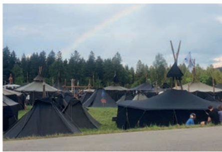
Zeltstadt aus Schwarzzelten