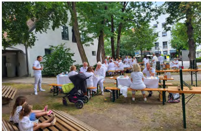
Weißes Fest am Pfarrer-Caspar-Mayr-Platz

Wir freuen uns, wenn Sie uns auch mal beim Stammtisch besuchen. Der nächste Termin ist Donnerstag, 25. August 2022 um 19:00 Uhr. Der Treffpunkt wird über www.csu-kh.de und die sozialen Medien bekannt gegeben. Sie können sich auch gerne per Email oder Telefonisch über den Ort des Stammtisches informieren. Aber auch sonst können Sie sich gerne mit Ihren Anliegen an uns wenden: per E-Mail unter info@csu-kh.de oder telefonisch unter 0151-57 81 82 11.