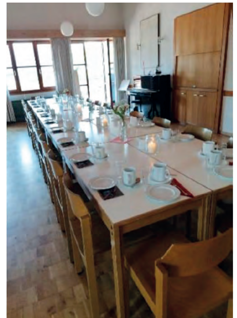
Dafür schlägt mein Herz