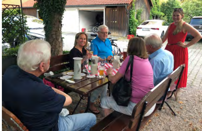
CSU-Stammtisch beim Neuwirt in Kirchheim

Seit einigen Monaten lädt die CSU Kirchheim-Heimstetten einmal im Monat – immer am letzten Donnerstag im Monat – zu einem Stammtisch ein. Der Stammtisch ist für alle offen und soll eine Plattform für einen gemeinsamen Austausch dienen. Das Themenspektrum lag dabei von der Welt- und Bundespolitik bis hin zur Landes- und Kommunalpolitik.