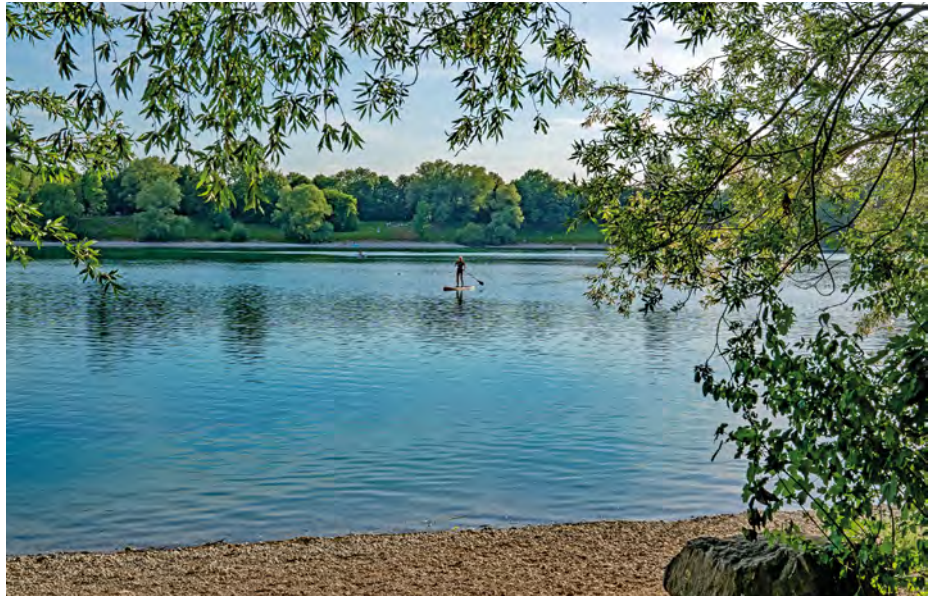
Immer wieder schön: Badespaß an unserer Fidsche. Für Sicherheit sorgt die Wasserwacht Feldkirchen.

Impressum: V.i.S.d.P.: Bürgermeister, Maximilian Böttl, Gemeinde Kirchheim, Münchner Str. 6, Redaktion: 089/90909-9314; kostenpflichtige Anzeigen: Tel. -9318; FAX 089/90909-9313; Internet: http://www.kirchheim-heimstetten.de , E-mail: KiMi@Kirchheim-Heimstetten.de ; Satzherstellung: pro MEDIA; DIGITAL PICTURE Druck u. Werbezentrum. Die Redaktion behält sich vor, Beiträge zu kürzen.