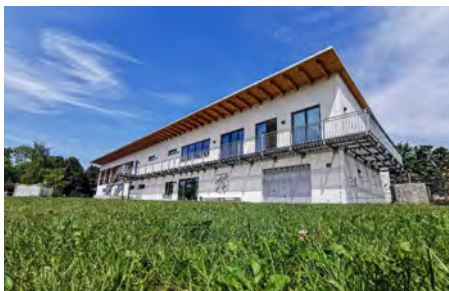
Blick auf's neue Gebäude

Ein Segen für den Verein, stellt das Ursel-Rechenmacher-Haus dar. 2014 wurde das fast 50 Meter lange Gebäude an der Florianstraße ein-