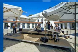
„Tune it“ aus Heimstetten