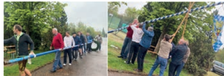
Traditionelles Aufstellen mit Muskelkraft und Schweiß