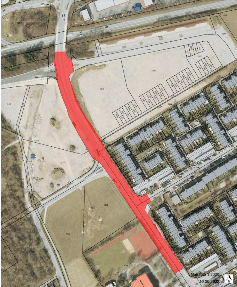
Umbau der Heimstettner Straße: Um mehr Sicherheit für Fußgänger und Fahrradfahrer zu erreichen, erfolgen Baumaßnahmen an der Heimstettner Straße. Die Arbeiten am nördlichen Abschnitt – von der Rathausstraße (ehemaliger südlicher Abfahrtsast der St 2082) bis Höhe Ampel an der Grund- und Mittelschule – beginnen am Montag, 7. Juni. Der betroffene Abschnitt wird dann für den Kfz-Verkehr gesperrt.

Die Heimstettner Straße wird umgestaltet und damit fußgänger- und fahrradfreundlicher. Vorbild ist das „Kopenhagener Modell“ - das Radwege durch Bordsteine mit Höhenversatz zum Gehweg und zur Fahrbahn begrenzt. Dadurch werden die verschiedenen Verkehrsarten wirksam getrennt und Konflikte gemindert. Der Umbau erfordert jedoch temporäre Verkehrseinschränkungen und Straßensperrungen, die vor allem den Kfz-Verkehr betreffen. Für Fußgänger,