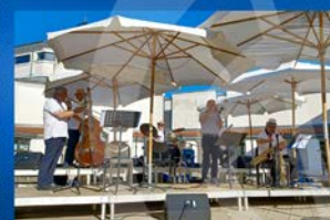
Munich Jazz Company