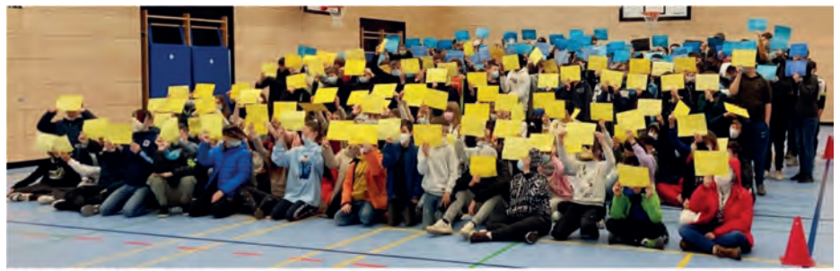
Mittelschüler zeigen Flagge

Kontakt: familienzentrum-kirchheim@gmx.de