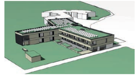
Illustrationen: Köhler Architekten und beratende Ingenieure GmbH