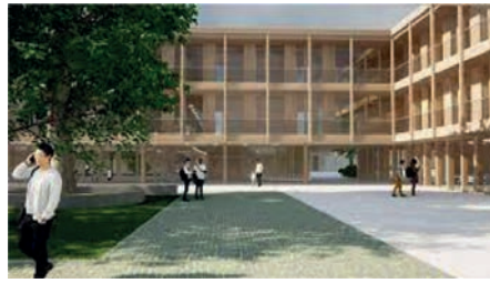
Illustrationen: Köhler Architekten und beratende Ingenieure GmbH