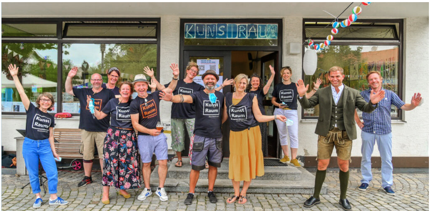
Der KunstRaum Kirchheim: Sorgt für Farbe und Lebendigkeit am Pfarrer-Caspar-Mayr Platz in Kirchheim.