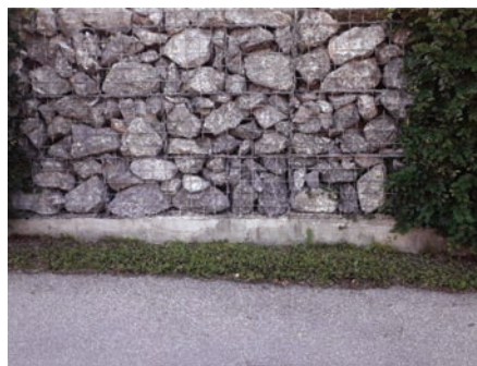
Diese Einfriedung hat wenige Möglichkeiten um Tieren Schlupflöcher zu bieten.

Die Gestaltung des Gartens kann die Artenvielfalt im Stadt- und Siedlungsbereich deutlich verbessern. Ein Ansatz dafür ist die Art und Weise wie eine Wiese oder ein Garten eingezäunt wird.