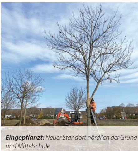
Eingepflanzt: Neuer Standort nördlich der Grund- und Mittelschule

Ziel der Verpflanzung ist es, die bestehenden Bäume in Kirchheim zu schützen und möglichst viel gewachsenes Grün zu erhalten. Darüber hinaus werden auf dem Landesgartenschau-Gelände bis 2024 mehr als 400 Bäume neu gepflanzt.