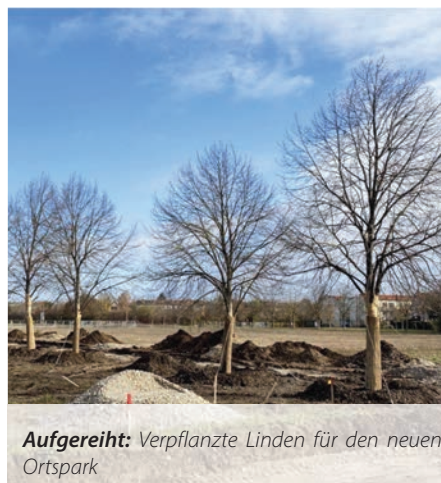
Aufgereiht: Verpflanzte Linden für den neuen Ortspark