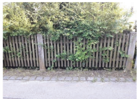
Bei diesem Gartenzaun finden Tiere leichter Schlupflöcher.

Wichtig dabei ist, dass der Zaun oder die Mauer genügend Platz lässt, damit Tiere wie der Igel noch Schlupflöcher finden. Wenn ein neuer Zaun gesetzt wird, eignen sich besonders Latenzäune die durchlässig sind für Tiere und Pflanzen. Der Zaun sollte außerdem erst in einer