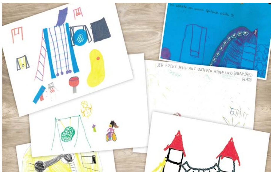
Zusammenspiel: Kirchheims Kinder wünschen sich neues Gerät für den Spielplatz am Theresienweg. Ihr Anliegen brachten sie mit vielen Bildern zum Ausdruck. Der Bauausschuss spielte mit und stimmte einer Sanierung, die auch die Inklusion fördert, zu.