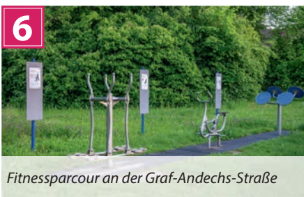
Fitnessparcour an der Graf-Andechs-Straße