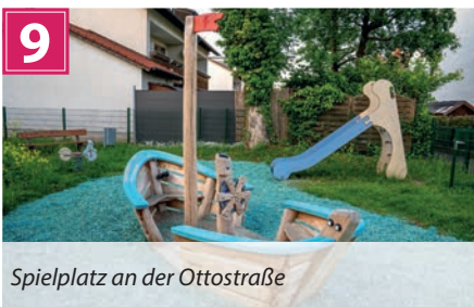
Spielplatz an der Ottostraße