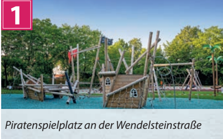
Piratspielplatz an der Wendelsteinstraße

Die Generationengemeinde investiert seit Jahren in ihre Spielplätze, um die Lebens-, Wohn- und Freizeitqualität in Kirchheim und Heimstetten zu erhöhen. Etliche Plätze wurden bereits saniert, weitere Anlagen folgen. Dabei werden die Wünsche von Jung und Alt berücksichtigt, um daraus Treffpunkte des Miteinanders zu machen.