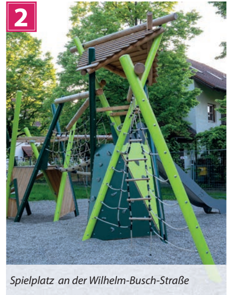
Spielplatz an der Wilhelm-Busch-Straße