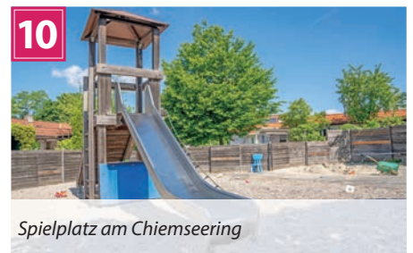
Spielplatz am Chiemseering