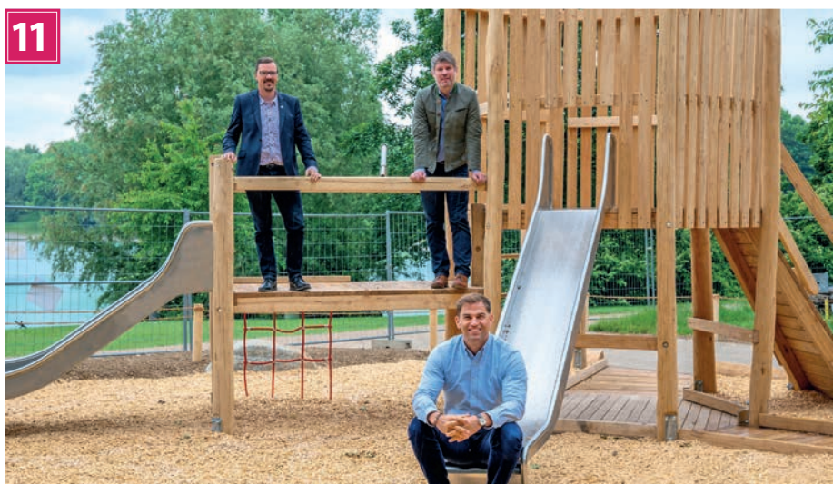
Noch mehr Spaß am See: An der Fidsche wurde der Spielplatz saniert und modernisiert