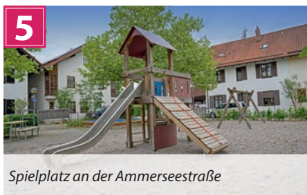
Spielplatz an der Ammerseestraße