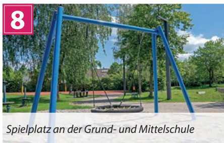
Spielplatz an der Grund- und Mittelschule