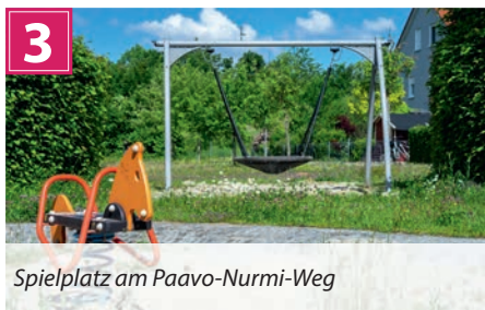
Spielplatz am Paavo-Nurmi-Weg