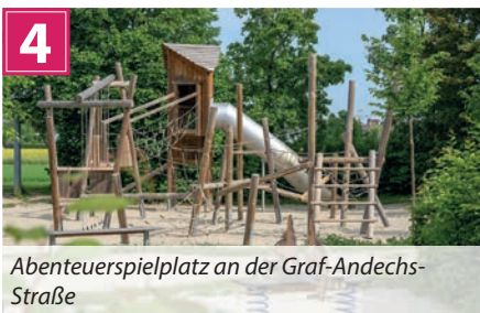
Abenteuerspielplatz an der Graf-Andechs-Straße