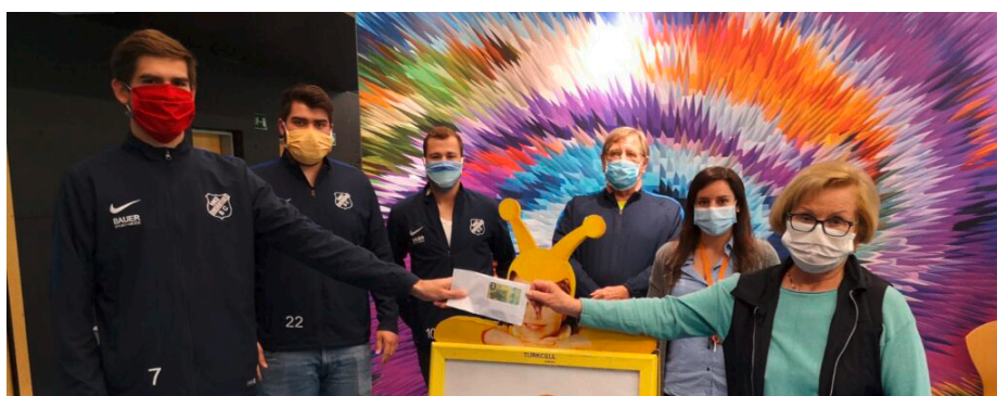
Sporteln für den guten Zweck: Die Zweite Mannschaft des Kirchheimer SC übergab der Tafel Kirchheim-Heimstetten einen Scheck über stolze 1.000 Euro.