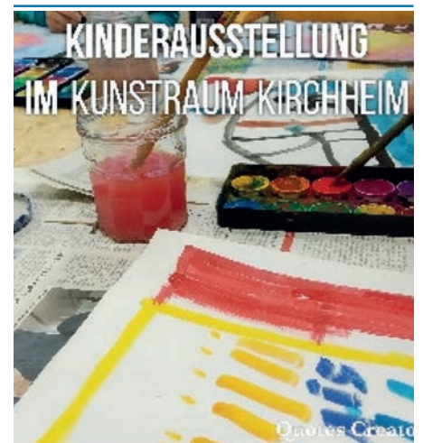
Kirchheimer Kinder kreativ: Die Kunstwerke der Kleinen werden im KunstRaum ausgestellt.

Es geht bald wieder los! Kreativ statt Negativ! Mit neuem Elan an die Kunst!