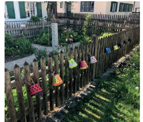
Kunst am Gartenzaun: Bunte Blumentöpfe für den Meilergarten bringen Farbenfreude nach Kirchheim.

meisten liefen jedoch). Dabei spendete jeder Spieler pro gelaufenem Kilometer einen Euro oder rundete sogar noch auf einen höheren Betrag auf. Durch die Mannschaftskasse und ein paar edle Spender wurde der Betrag noch einmal auf beachtliche 1.000 Euro erhöht. Die Spende kommt zu 100 Prozent der Tafel Kirchheim-Heimstetten zu Gute und wurde bereits übergeben. Die Jungs freuen sich nun auf ein baldiges Wiedersehen mit ihren Fans am Mero.