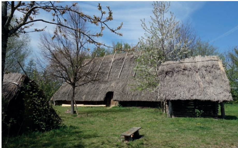
Geschichte erleben: Der Bajuwarenhof öffnet am Pfingstsonntag von 11 bis 17 Uhr.