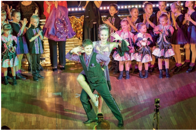
Kinderprinzenpaar freut sich auf Euch!